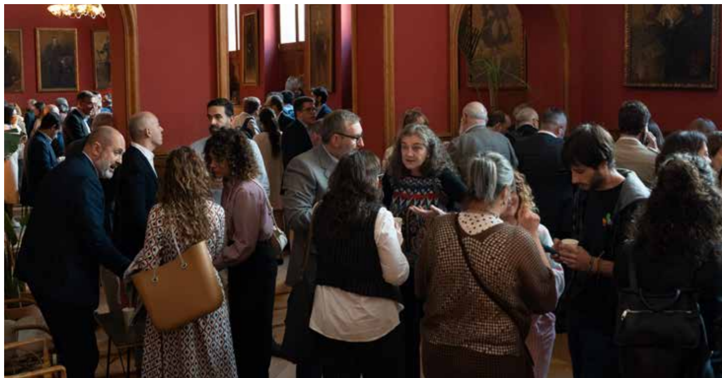
Participantes en el III Foro Minería y Vida.