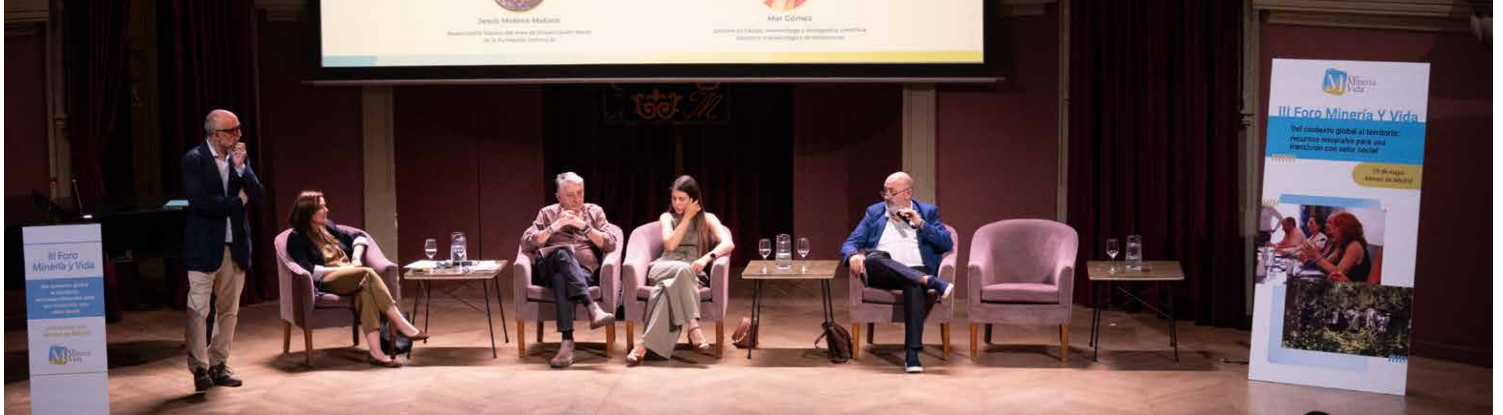
Mesa redonda III. Comunicación y relato: cómo cerrar la brecha con la sociedad.