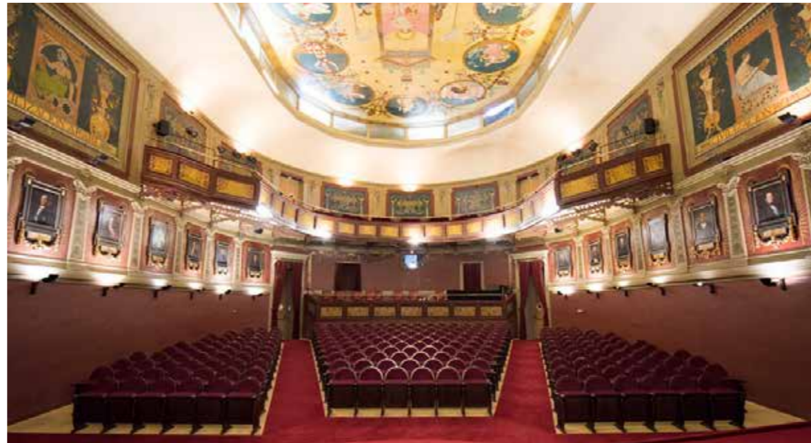
Cátedra Mayor del Ateneo de Madrid, lugar de celebración del III Foro Minería y Vida.

El Ateneo de Madrid, institución con más de 190 años de historia y referente del pensamiento crítico y el debate cultural en España, fue elegido sede del encuentro por su prestigio, la adecuación de sus espacios y la coherencia simbólica que ofrece un lugar históricamente asociado al diálogo y la convivencia de ideas.