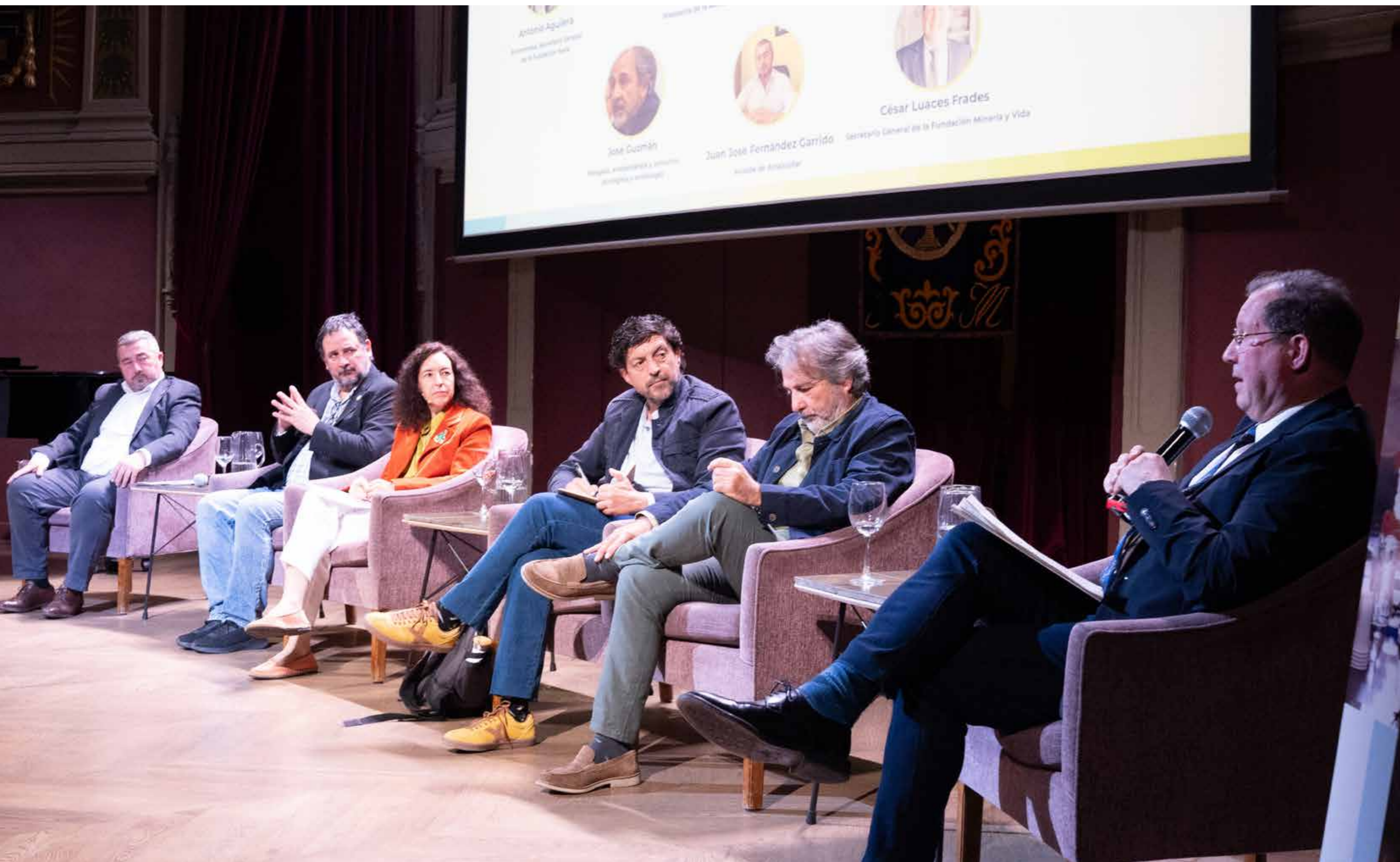
Mesa redonda I. Minería y territorio: confianza, diálogo y valor compartido.